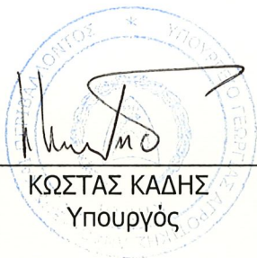
ΚΩΣΤΑΣ ΚΑΔΗΣ Υπουργός

Για το Υπουργείο Γεωργίας, Αγροτικής Ανάπτυξης και Περιβάλλοντος